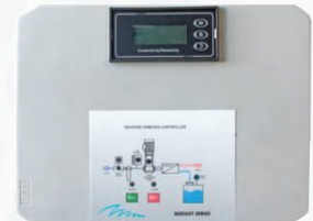
Yatay Budget Kontrol Panosu