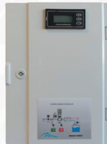
Dikey Budget Kontrol Panosu